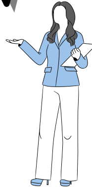
Okul Psikolojik Danışmanı

Devamsızlık, öğrencinin velisinin bilgisi dışında veya izinsiz, sevksiz, raporsuz okula gelmemesi durumudur.